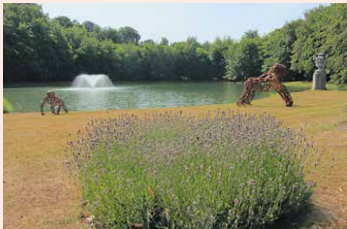
'Gorilla's on the move' van Maarten Schaubroeck in het Rivierenhof in Deurne

GruunRant omsluit de woonkernen van Merksem, Ekeren, Brasschaat, Schoten, Schilde, Wijnegem en Deurne. Tijdens onze ontspannende tocht komen we zowel bekende als minder bekende bezienswaardigheden tegen. We maken kennis met tal van kastelen en domeinen. Ongewild zorgde de adel van weleer voor natuurbehoud, dankzij de aanwezige parken, domeinen en bossen die we nu nog altijd kennen. Een aantal daarvan bleef in privébezit, andere werden aangekocht door lokale