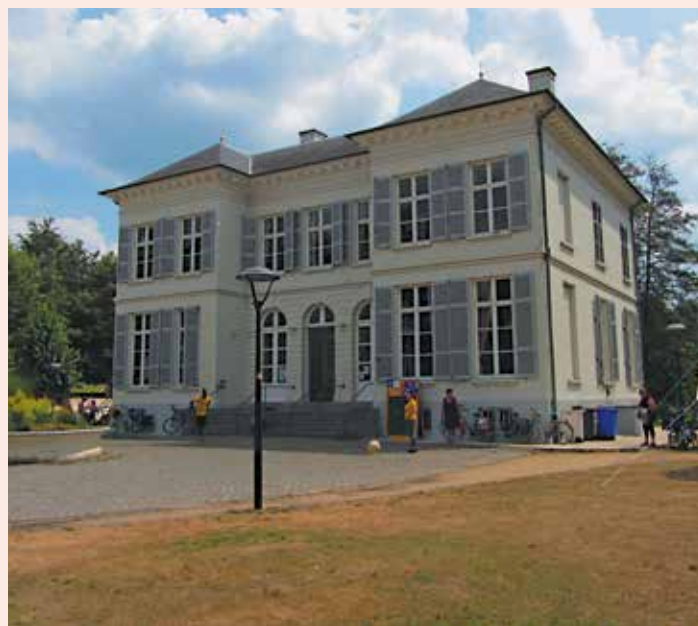
Kasteel Bouckenborg in Merksem

Kijkuit, eigendom van de adellijke familie Van Havre. Automatisch komen we uit op het Albertkanaal, dat Antwerpen met Luik verbindt. Eens de brug over deze waterweg overgestoken, zien we achter de watertoren het Wijnegempark liggen. Na enkele pedaalslagen bereiken we de parking waar we eerder deze dag onze tocht achterlieten. Zo beleefden we een deugddoende rit met veel groen – wat je niet echt verwacht zo dicht bij de stad Antwerpen – waarbij niet de auto, maar de fiets koning is.