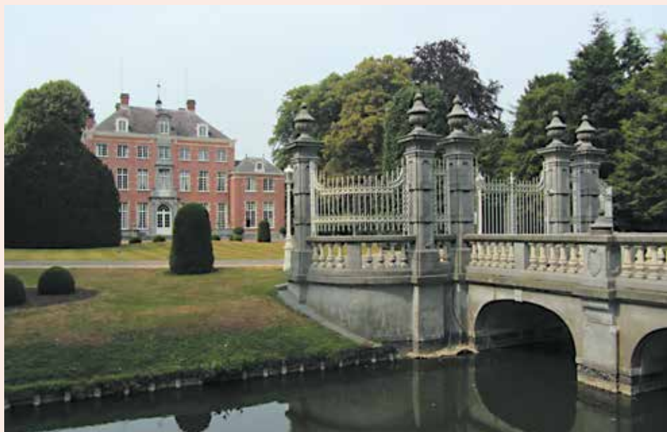
Kasteel Kijkuit in Wijnegem