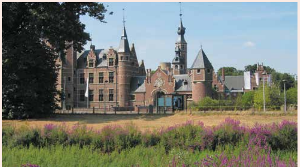
Sterckxhof in Deurne

Van Ekeren gaat het naar Brasschaat waar we voorbij de Brusselse Bossen fietsen. Dat gebied (27 hectare) vormt samen met de speelzone Kattekesberg (10 hectare) één geheel. De hele zone is eigen-