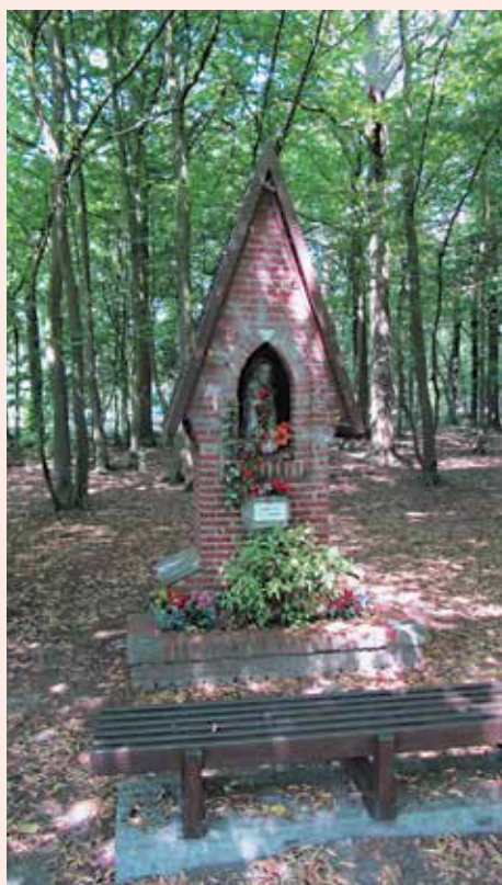
Kapel in het Zurkelbos in Schoten